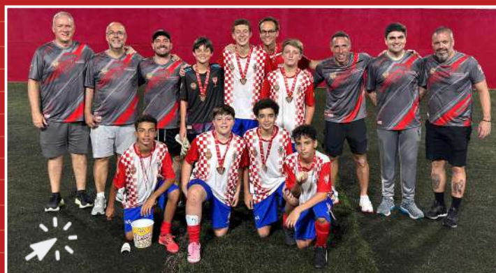
Croácia campeão – Início Mirim