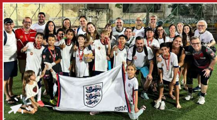
Inglaterra campeão – Início Pré-Mirim