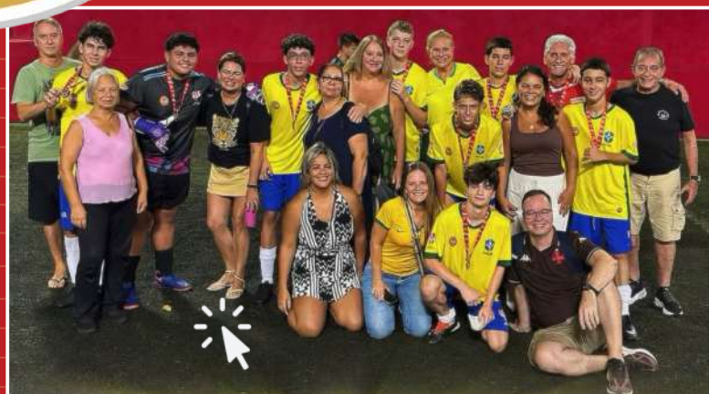
Brasil campeão – Início Categoria Infantil

Clique nas fotos e veja os vídeos dos melhores momentos dos jogos que consagraram Croácia, Inglaterra e Brasil campeões da fase inicial do campeonato.